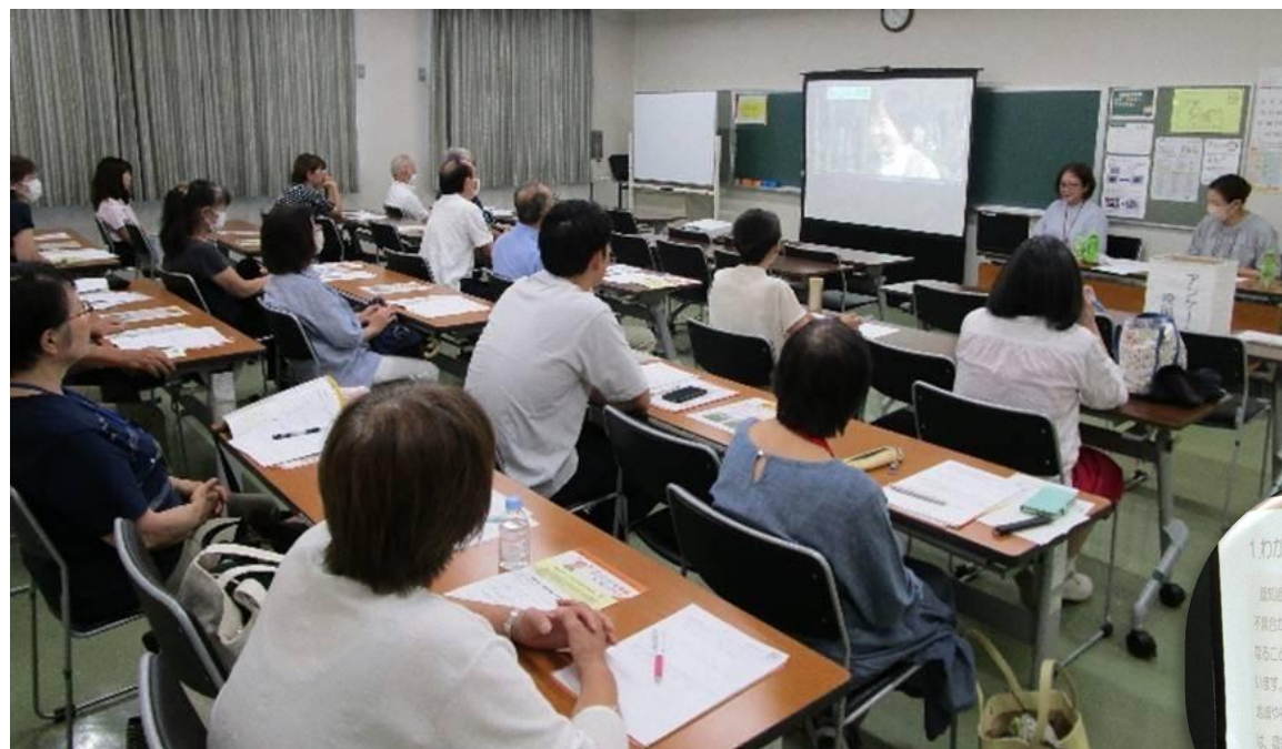
認知症の方への接し方。良い例と悪い例をDVDで視聴

今年も、千葉市あんしんケアセンター松ヶ丘さんに講師を依頼し、8月30日に松ヶ丘公民館で講座を行いました。「認知症とはどんな症状なのか」「認知症の人にはどう接したら良いのか」分かりやすい講義とDVDで勉強しました。