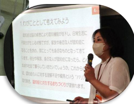
小柳センター長による講義

今年も、千葉市あんしんケアセンター松ヶ丘さんに講師を依頼し、8月30日に松ヶ丘公民館で講座を行いました。「認知症とはどんな症状なのか」「認知症の人にはどう接したら良いのか」分かりやすい講義とDVDで勉強しました。