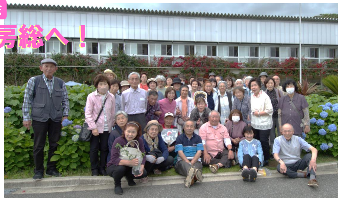
保田小学校、紫陽花の前で

恒例のバス視察旅行、今年は6月2日、46名の参加がありました。館山の「赤山地下壕跡」ではヘルメットを被って戦争遺跡を見学。お昼は鋸南町の「ばんや」で。午後は「保田小学校」、鴨川の「大山千枚田」等を見学しました。企画・引率して下さいました役員皆さん、ありがとうございました。