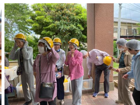
赤山地下壕、ヘルメットを被って