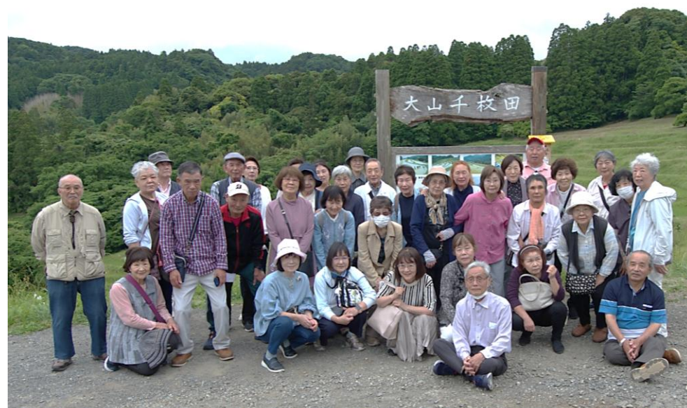
美しい大山千枚田で