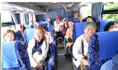
バスの中も楽しい！