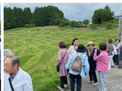
大山千枚田を散策